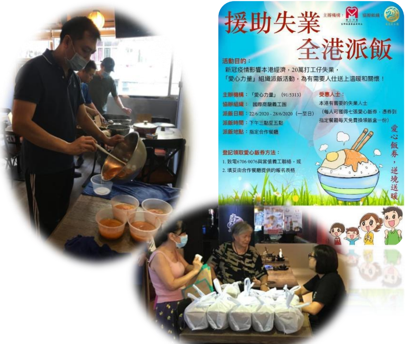
《援助失業全港派飯》